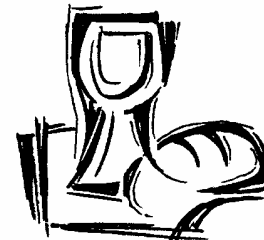
Gründonnerstag: Ein Mahl für alle Zeiten