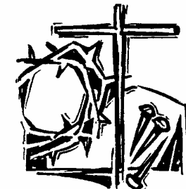
Karfreitag: Mit Verbrechern gekreuzigt