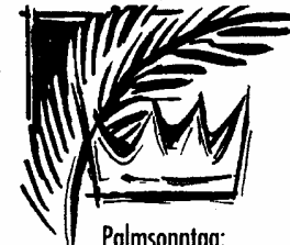
Palmsonntag: Wie ein König bejubelt